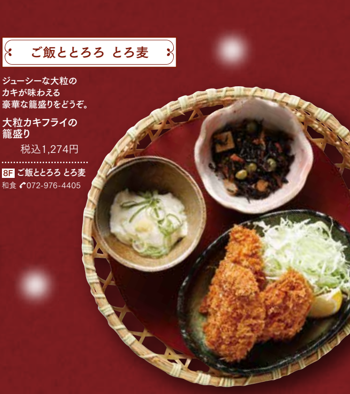
ご飯ととろろ とろ麦

とろ〜りと溶けた 濃厚チーズがたまらない! チーズタッカルビ定食 税込980円 BF パラダイス 発酵熟成肉&韓国カフェ ☎072-943-1235