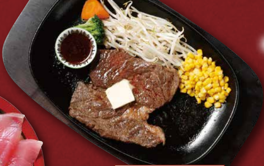
3Bステーキ&バーガー

ジューシーで食べ応えのある ステーキは大満足間違いなし! US牛肩ロースステーキ (300g) 税込2,750円 (150g) 税込1,430円