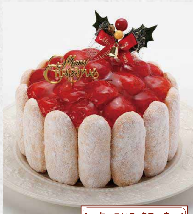
ケーニヒス クローネ

いちごクリームとカスタードクリーム、 ふたつの甘さをたっぷりサンド。おいしく色鮮やかに。