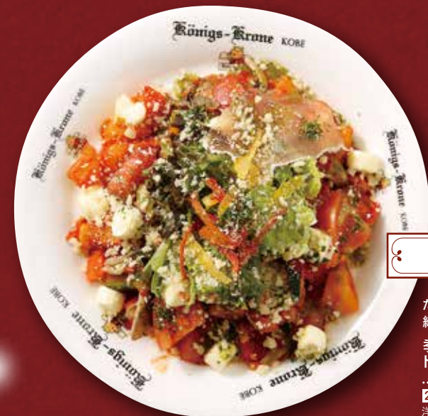
ケーニヒス クローネ

たっぷり季節の野菜と濃厚なチーズが 絡み合うリッチな味わい。 季節野菜と2種のチーズの トマトパスタ 税込1,998円